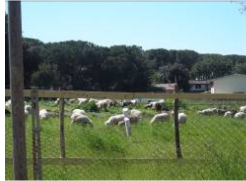
(come era l'area di Via Salerno dove oggi si costruisce la convenzione 'Parco di Plinio', vera colata di cemento...)