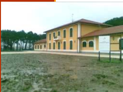
Foto dell'antico casale.