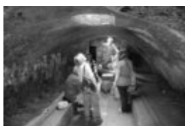
li appositamente, poiché

Si è svolta il 9 maggio 2010 la prima di una serie di visite guidate organizzate dal Comitato Civico 2013 per tutti i suoi soci agli scavi di Ostia Antica. Tema di questa prima uscita: “Il mondo dell'acqua: impianti termali, ninfei e acquedotti”. L'itinerario inizia da Porta Romana, e dopo aver superato la zona della necropoli, inoltrandosi in una zona solitamente poco battuta dai turisti, si scoprono quelli che l'occhio di una guida esperta riconosce come resti dell'acquedotto romano che doveva garantire un sufficiente rifornimento idrico alla città di Ostia: purtroppo è molto difficile riuscire ad individuarlo a meno che,