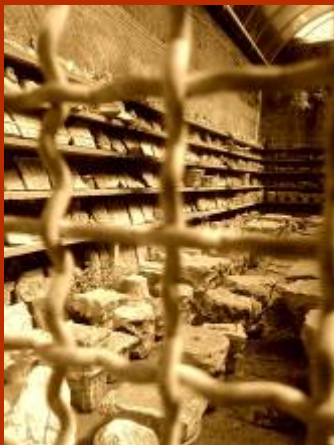
Un deposito di marmi rinvenuti dentro gli scavi, presso il Piccolo Mercato

“Non potrei vivere in una casa pagata forse da altri”